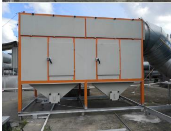
高效生物廢氣淨化設備